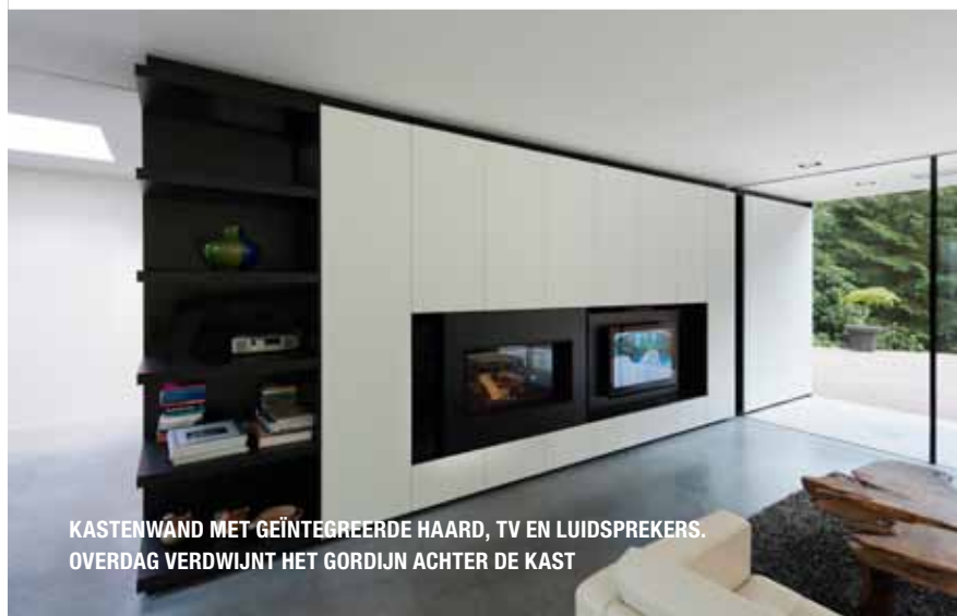
KASTENWAND MET GEÏNTEGREERDE HAARD, TV EN LUIDSPREKERS. OVERDAG VERDWIJNT HET GORDIJN ACHTER DE KAST