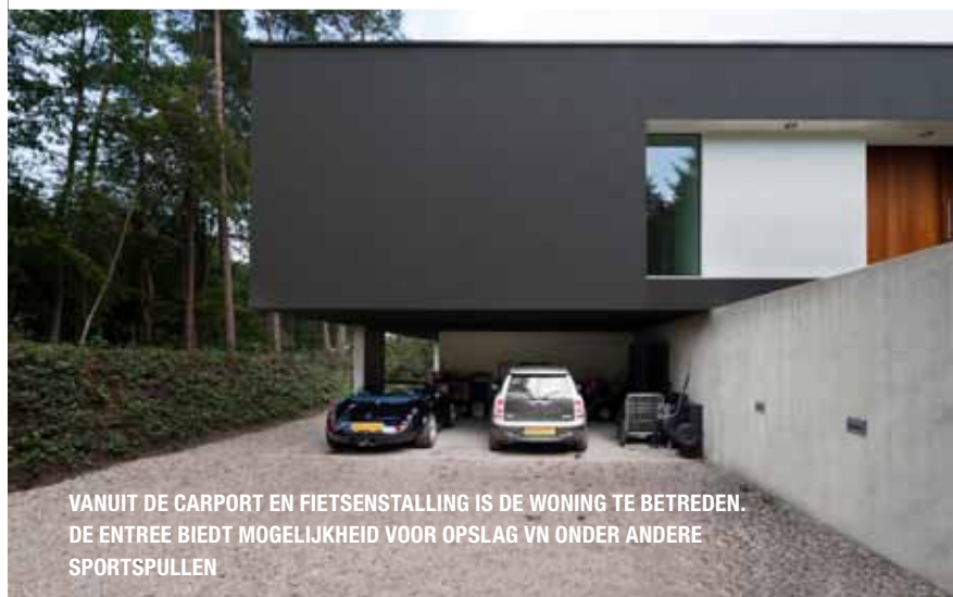
VANUIT DE CARPORT EN FIETSENSTALLING IS DE WONING TE BETREDEN. DE ENTREE BIEDT MOGELIJKHEID VOOR OPSLAG VAN ONDER ANDERE SPORTSPULLEN