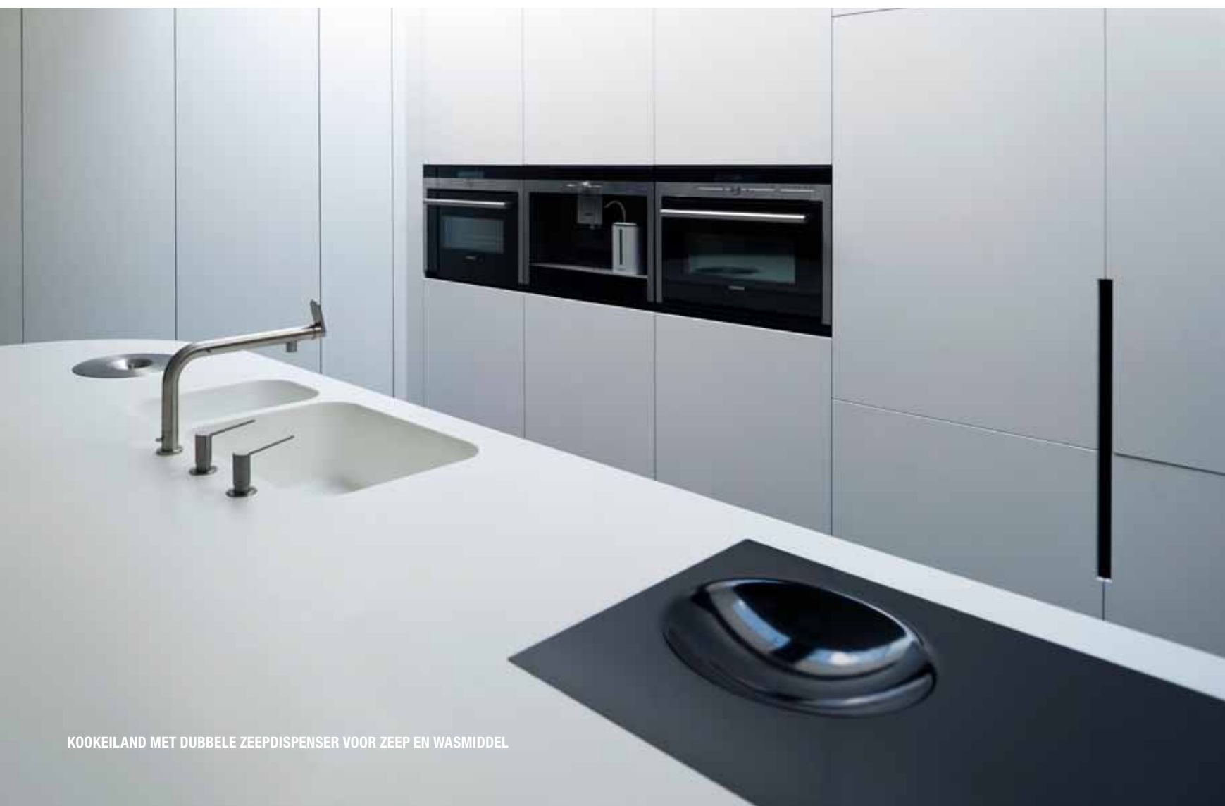
KOOKEILAND MET DUBBELE ZEEPDISPENSER VOOR ZEEP EN WASMIDDEL