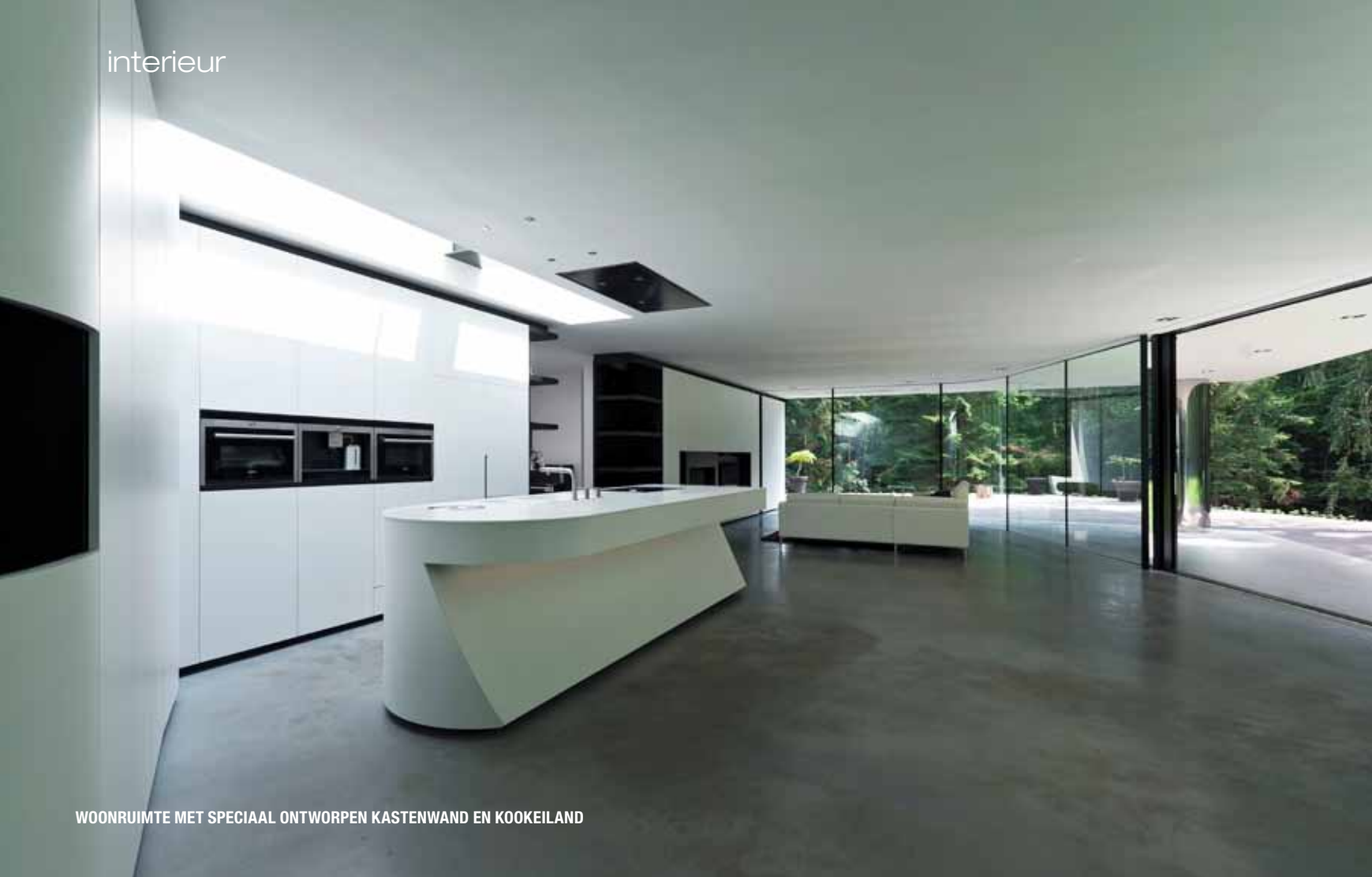
WOONRUIMTE MET SPECIAAL ONTWERPEN KASTENWAND EN KOOKEILAND