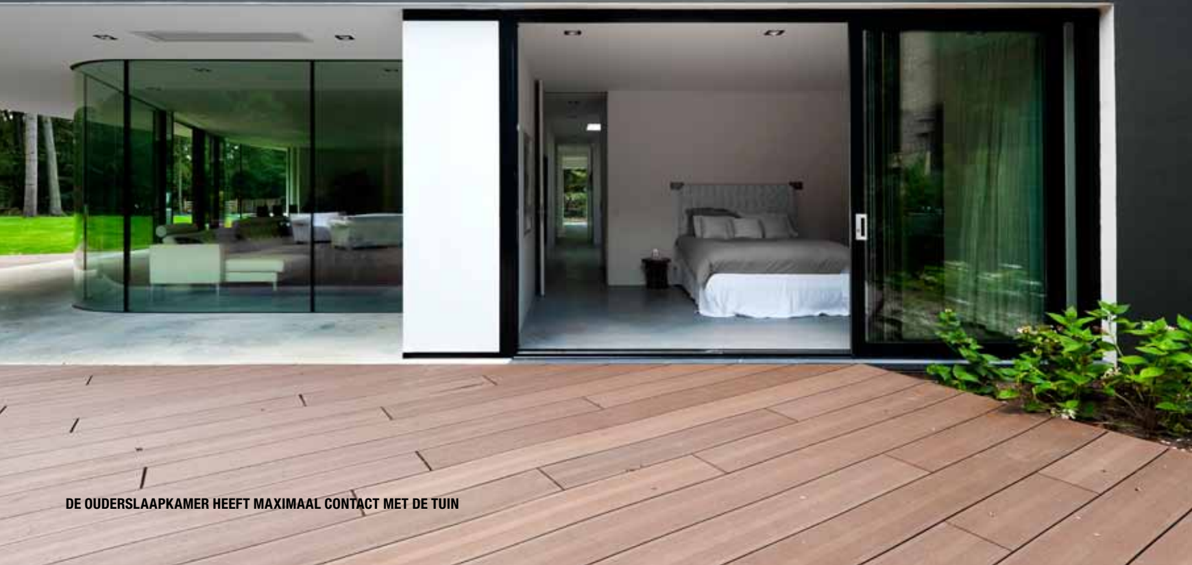
DE OUDERSLAAPKAMER HEEFT MAXIMAAL CONTACT MET DE TUIN